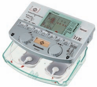
Stimulateur neuromusculaire EW6021

Station de massage électronique bi-canal