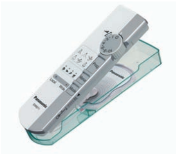
Stimulateur neuromusculaire EW6011

Technologie de pointe pour votre bien-être. Stimulations neuromusculaires et massages.