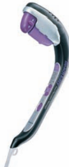
Masseur portable EV2610

Massage mécanique par percussion et vibration combinées. Programmes automatiques et manuels.