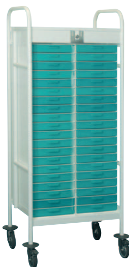
Chariot nu réf. CHAPT134V code 54105 H 1340 x 590 x 409 mm