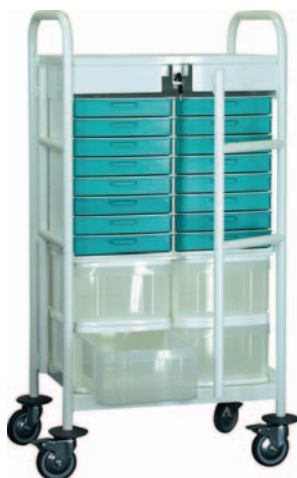
Chariot nu réf. CHAPT110E code 54104 H 1100 x 590 x 409 mm 1 étagère intermédiaire