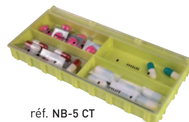
réf. NB-5 CT