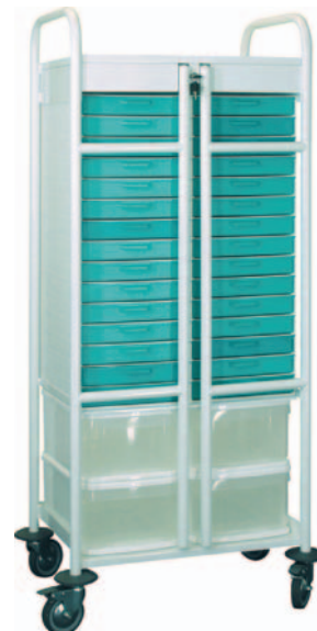
Chariot nu réf. CHAPT134E code 54106 H 1340 x 590 x 409 mm 1 étagère intermédiaire