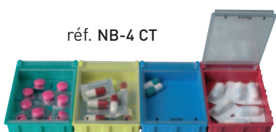
réf. NB-4 CT