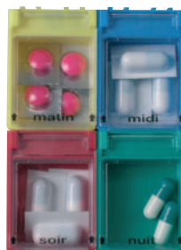
réf. NB-3 CT