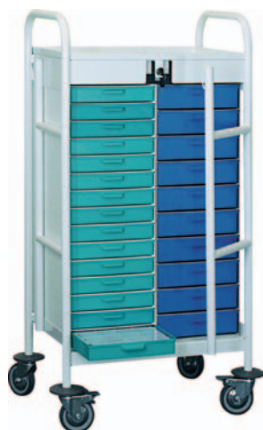
Chariot nu réf. CHAPT110V code 54103 H 1100 x 590 x 409 mm