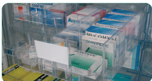
ex. : médicaments