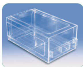
réf. M30000 code 11105