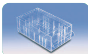
réf. M7000 code 11103