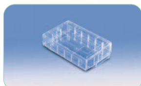
réf. M2000 code 11102