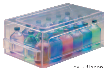
ex. : flacons