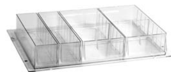
réf. MP640 + TS5000 A &amp; C