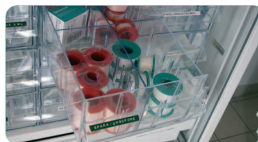
ex. : pharmacie