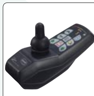
ACS, REM 24 SD En option.