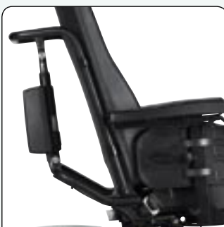
Inclinaison de dossier électrique Sur AP2