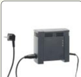
Chargeur Charge complète en 5 heures.