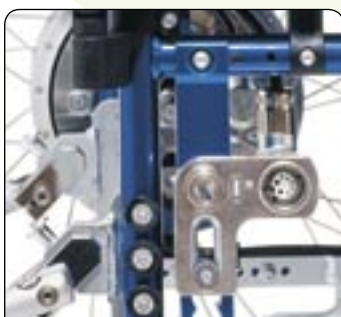
Fixation pour fauteuil roulant Disponible pour de nombreux fauteuils (veuillez consulter votre service clients).