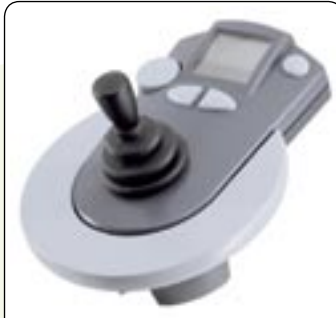
Manipulateur Grand indicateur de batterie, interrupteur intérieur/extérieur, réglage de la vitesse, avertisseur sonore.