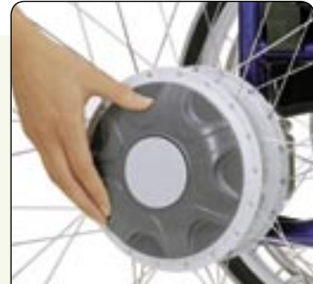
Conduite manuelle Débrayer le moteur et entraîner manuellement.