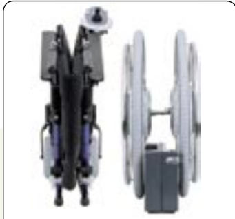
Alber e-fix® prêt au transport Les composants compacts et légers sont faciles à transporter.