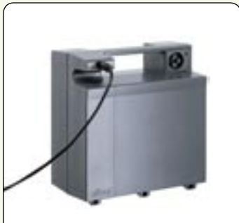
Batterie 12Ah Permet une autonomie d'environ 16 km.