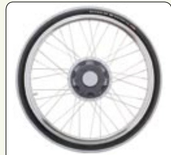
Roue motorisée Disponible en diamètres 22", 24".