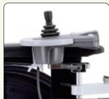
Support escamotable Manipulateur escamotable parallèlement pour un meilleur accès à la table.