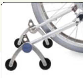
Supports anti-bascule Réglables en hauteur, angle et longueur.