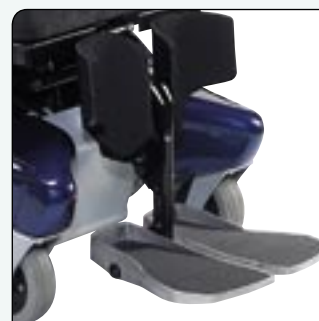
Repose-jambes électrique en option La palette descend manuellement au sol pour faciliter le transfert.