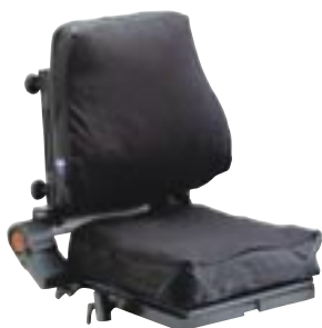
Assise et Dossier Flex avec coussins Vicair®