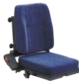
Assise et Dossier Flex avec extension de dossier et appui-tête