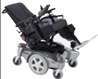
Assise inclinable en arrière Manuelle ou Electrique en option jusqu'à 35^\circ .