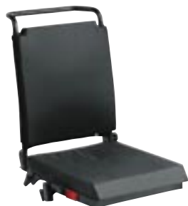
Assise et Dossier Standard