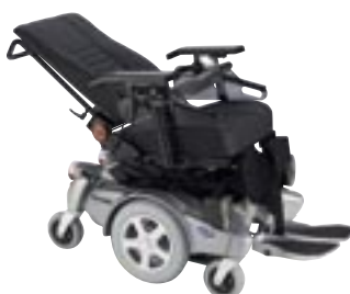
Dossier inclinable Par vérin pneumatique ou électrique.