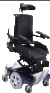
Assise Inclinable en avant électrique

L'inclinaison négative à -10^\circ facilite les transferts.