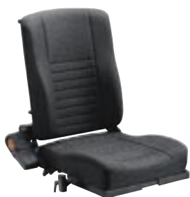
Assise et Dossier Kontour