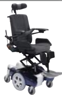
Lift Electrique en option : permet d'ajuster la hauteur d'assise de 38 cm à 68 cm ou de 45 cm à 75 cm.

L'inclinaison négative à -10^\circ facilite les transferts.