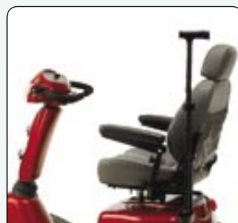
Porte canne Pour deux cannes ou deux béquilles