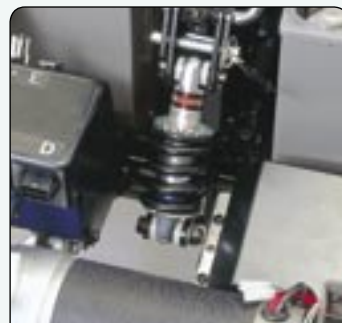
Suspension arrière Réglable selon les souhaits individuels sur Auriga ® 4 roues