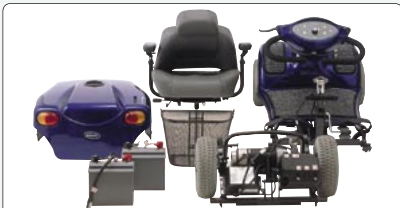
Démontable Une fois démonté, le scooter est facilement transportable