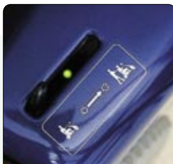
Témoin de charge Un voyant vert indique que le scooter est en charge