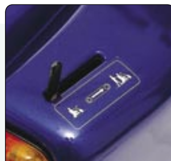
Levier de débrayage Débloquez le frein moteur pour déplacer le scooter manuellement