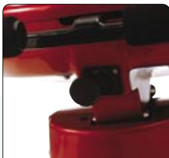
Prise pour mise en charge (charge externe)